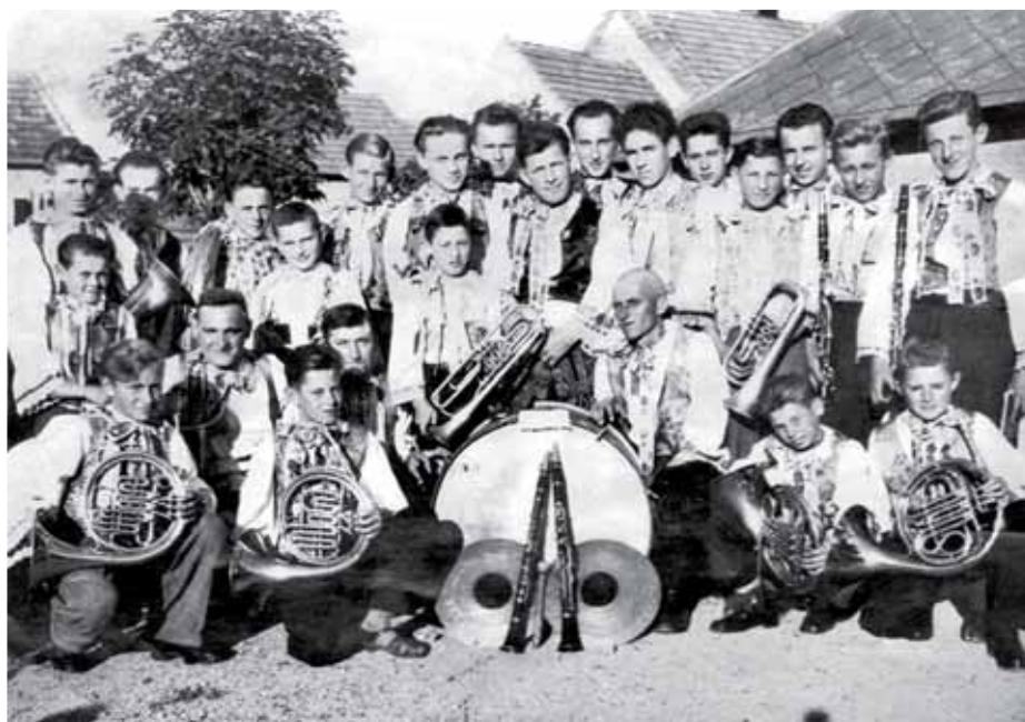
Detská a mládežnícka dychovka