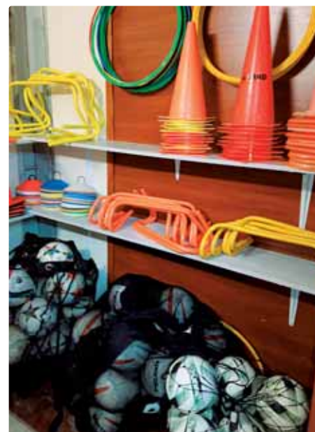
Police v šatni prípraviek