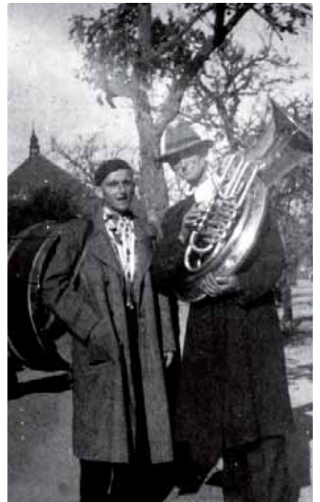
Nástroj je vzácna vec

Začiatky, ako vždy sa opakujúce v tejto aj predchádzajúcich dychovkách boli, že treba doplniť hudobné nástroje a i novší notový materiál. Tak sa kolotoč opakuje, nástroje si nakupujú zo svojich skromných finančných prostriedkov, pomohla aj zbierka v obci ale aj niektoré spolky vo Vajnorochoch pridali podľa možností. A notový materiál, ako bolo už spomínané, stále dopĺňal tento nový kapelník.