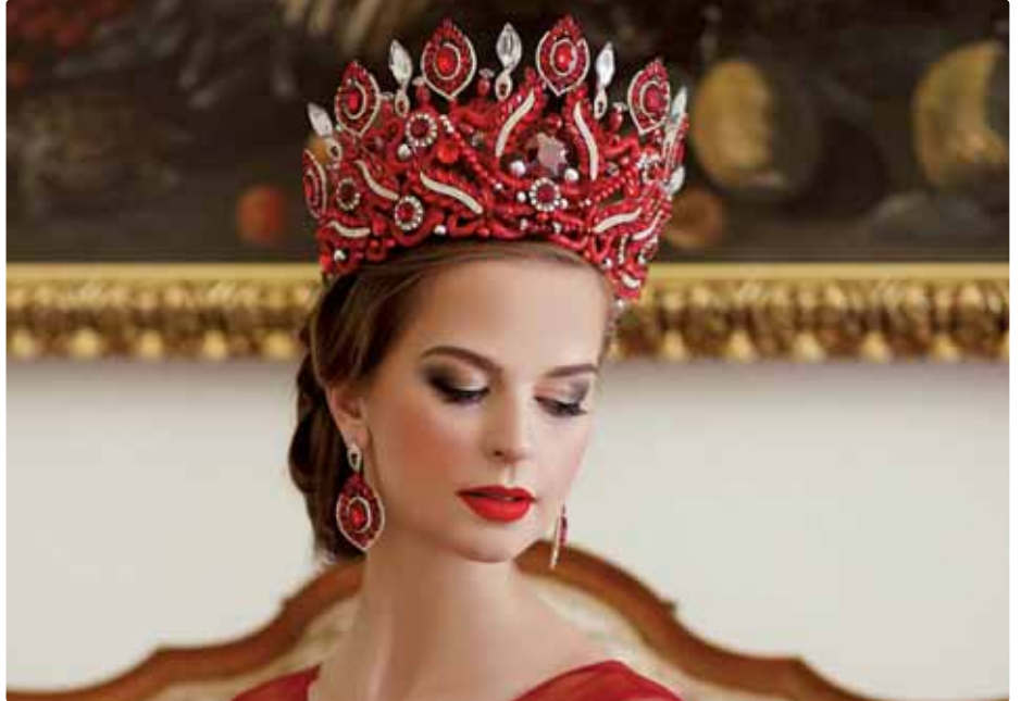
Dáma v červenom