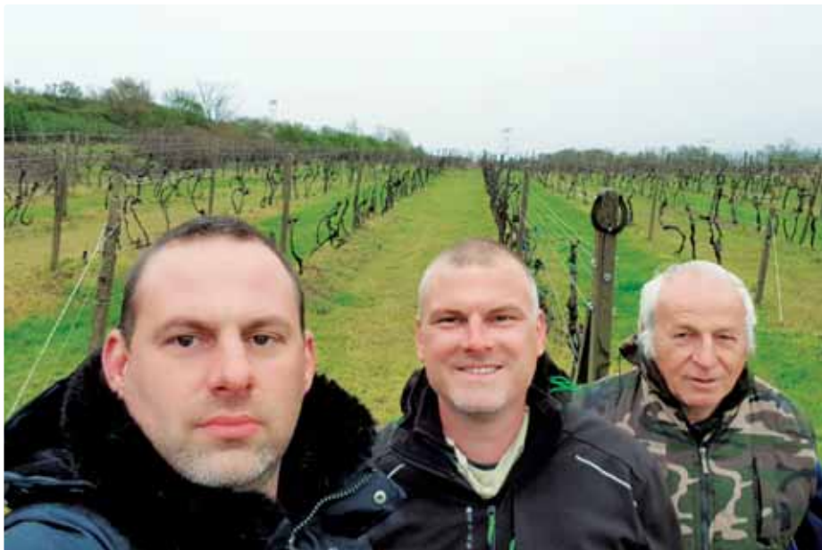
Členovia správnej rady VSV po hodnotení stavu viníc