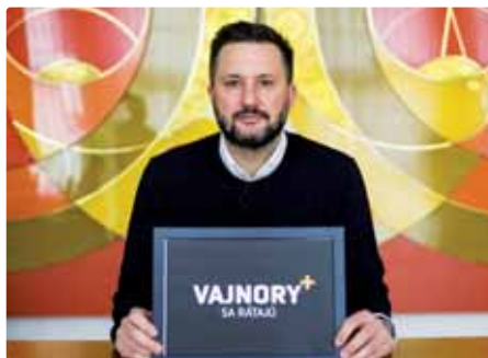
Primátor Matúš Vallo

Aj vo Vajnoroch prebiehala kampaň, ktorá mala za cieľ presvedčiť Vajnorákov a Vajnoráčky, aby sa sčítali. Súčasťou kampane bolo aj exkluzívne hlásenie miestneho roz-