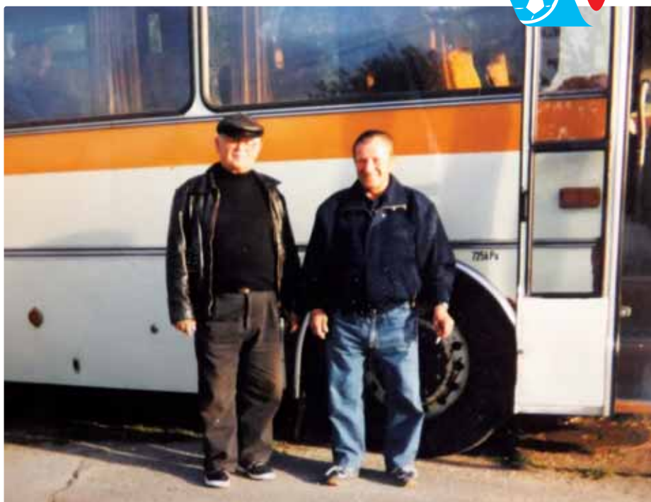
Spolu pred cestou na zápas mužov