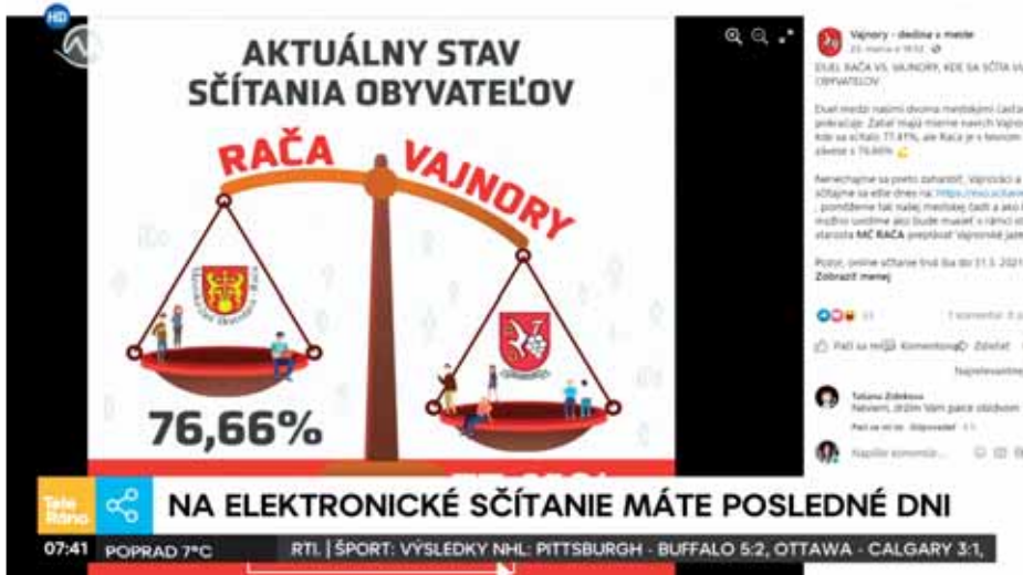
Rača vs. Vajnory v teleráne TV Markíza