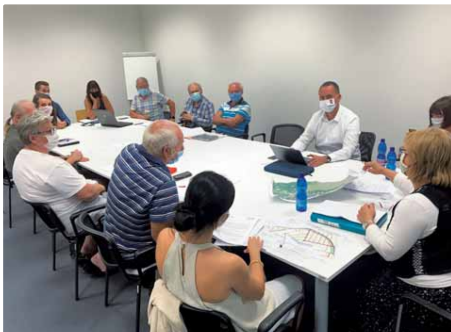
Stretnutie k Nemeckej doline