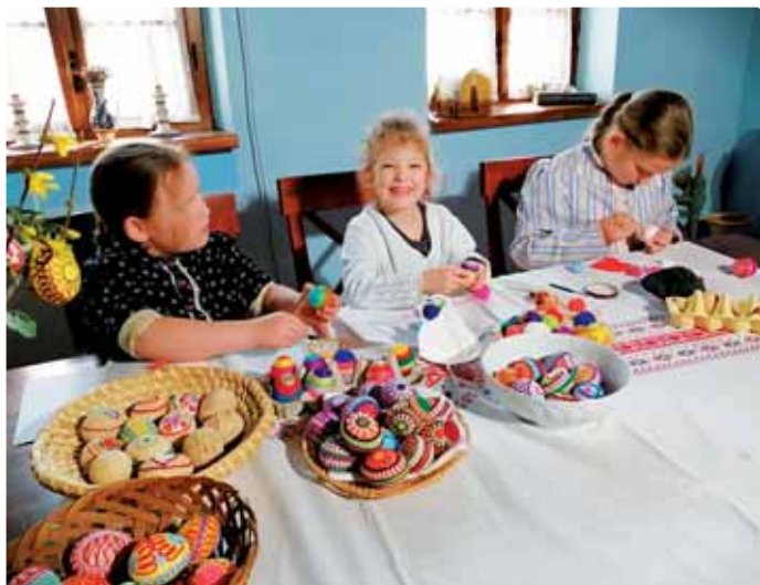
Dievčatá zobia výdušky