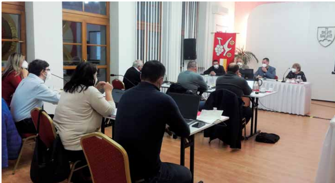
Zasadnutie miestneho zastupiteľstva