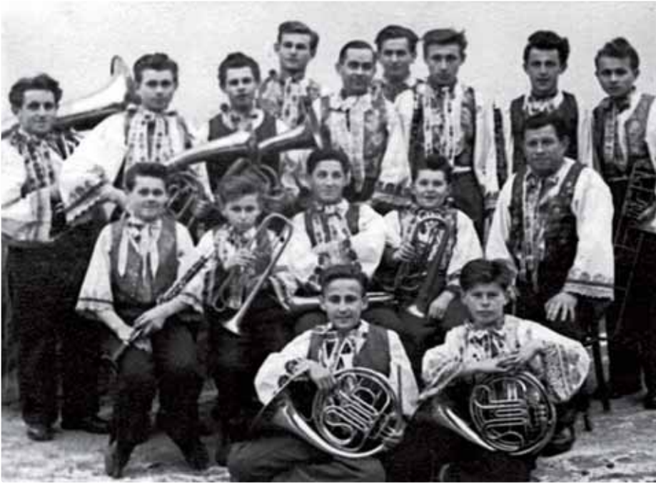
Na zájazde v Luhačoviach