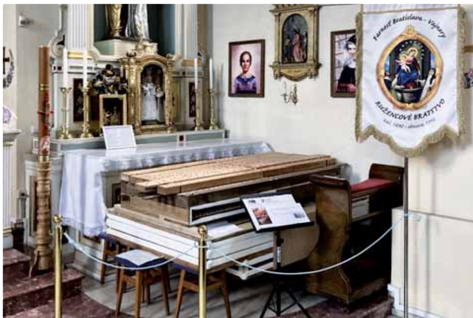
Rreštaurovaný mech a vzdušnica 1. manuálu v kostole

v chráme Sedembolestnej Panny Márie vo Vajnorochoch (3)