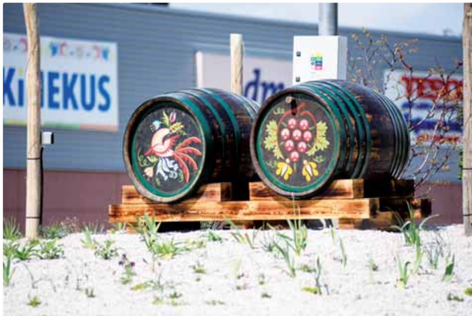
Sudy na kruhovom objazde

Pri križovatke Rybníckej a Dorasteneckej ulice pokračujeme v projekte letníckových záhonov z priameho výsevu. S potešením môžeme konštatovať, že minuloročné letničky sa samy vysemenili a vyklíčili, takže nástup kvitnutia bude omnoho skôr ako pri prvom výseve. Aby stredový ostrov vyzeral usporiadanejšie, vysiali sme po obvode kruhu trávnik, ktorý sa bude pravidelne kosiť. Som si vedomý veľkej polarizácie názorov na tento typ výsadies, no skúsme sa na to zahľadieť aj inou ako úhľadnou a puntičkárskou optikou. Dajme šancu prírodným typom záhonov s nízkou potrebou údržby a vysou-