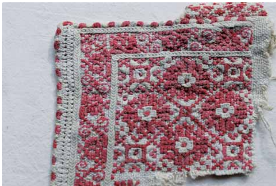
Detail puntu košele