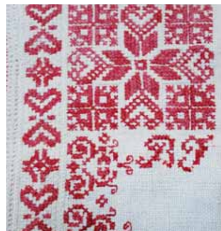
Detail puntu košele s monogramom BJ