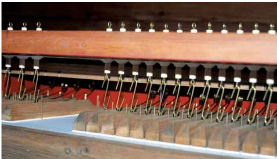
Detail ventilovej komory vzdušnice 2. manuálu

Organové diely, ako hriadeľová doska, kanály, pedálová vzdušnica, píšťaly, tiahla a pod, sú pripravené na montáž, pri ktorej budú vykonávané ďalšie dôležité práce ako montáž mechu, čiastočné umiestnenie kanálov pod dlážku chóru, zapojenie kanálov a elektrického dúchadla, umiestnenie vzdušnic, zapojenie a regulovanie chodu traktúr, osadenie a intonovanie píšťal a nakoniec ladenie celého organa. Montáž sa začne po dokončení prác na oprave dlážky chóru.