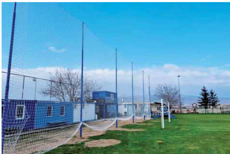
Nové stĺpy a ochranná sieť

je miesto. Z grantov, do ktorých sme sa od začiatku roka zapojili, bol zatiaľ v náš prospech vyhodnotený jeden. Magistrát hlavného mesta nám venoval 1 500 eur na nákup tréningových pomôcok. Budú to obštrielovacie panáči, ktorí majú v tréningoch pestré využitie, a takzvané sensebally – malé loptičky na šnúrkach. Tie rozdáme najmenším deťom, aby mohli v domácom prostredí doháňať zameškané počas pandemických mesiacov.