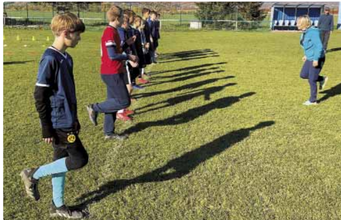
Trénerka a mladší žiaci U13