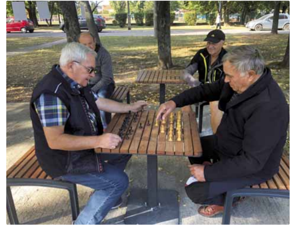
Šachové stoly na petangovom ihrisku

Sme veľmi radi, že sa nám v Rakús parku, kde sme vybudovali petangové ihrisko, osadili dva šachové stoly a staré parkové lavičky vymenili za nové, podarilo vytvoriť miesto pre aktívne trávenie voľného času. Táto oddychová zóna bude slúžiť nielen seniorom, ale aj všetkým občanom našej mestskej časti.