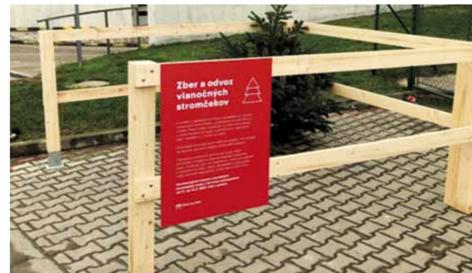
Ohrádka na zber vianočných stromčekov

Prosíme obyvateľov Bratislavy, aby na odkladanie vianočných stromčekov maximálne využívali ohrádky vo svojej mestskej časti a prispeli tak k udržaniu poriadku v meste.