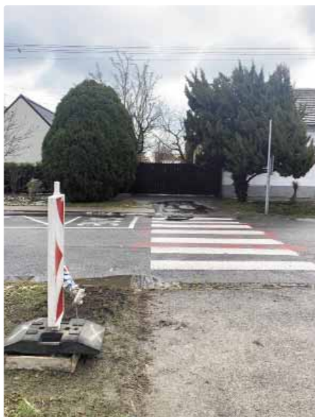
Priechod na Roľníckej pri Hospodárskej ulici bude taktiež osvetlený