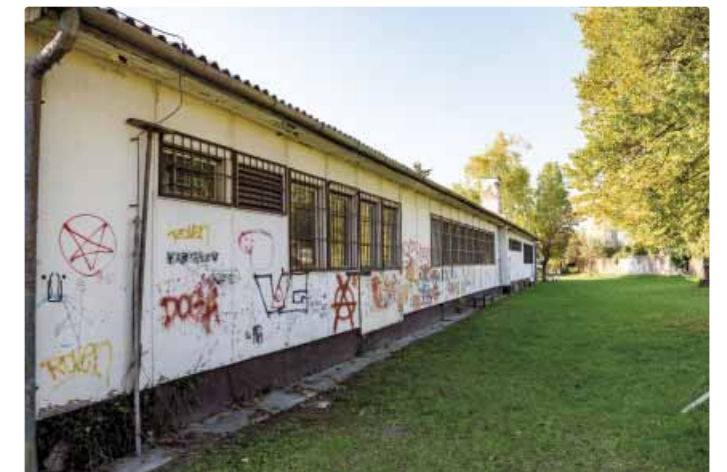
Budova na Šaldovej ulici

V minulosti sa v nej nachádzala materská škôlka, ktorá bola pre nevyhovujúci stav v 90-tych rokoch zrušená. Budova tak prešla do vlastníctva Ministerstva vnútra Slovenskej republiky a jej technický stav sa zhoršoval. Objekt chátral, a strácal tak na svojej hodnote. Medzičasom sa využíval ako sídlo mestskej polície, knižnice či keramickej dielne. Momentálne sa priestory budovy stali miestom