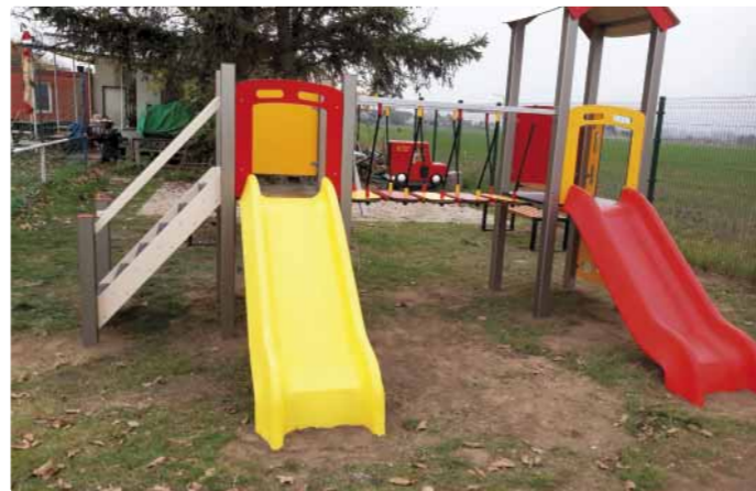
Nové mini ihrisko