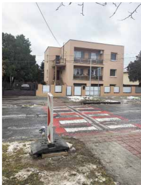
Prípravné práce na osvetlenie chodníka na Rybníckej

Tretím je vjazd do Vajnor na Rybníckej ulici. Rovinka a kombinácia zníženej viditeľnosti nás jednoznačne primäla uvedený priechod osvetliť a urobiť ho bezpečnejším. Naším zámerom je postupne osvetliť všetky priechody vo Vajnoroch a chrániť bezpečnosť všetkých našich obyvateľov a chodcov.