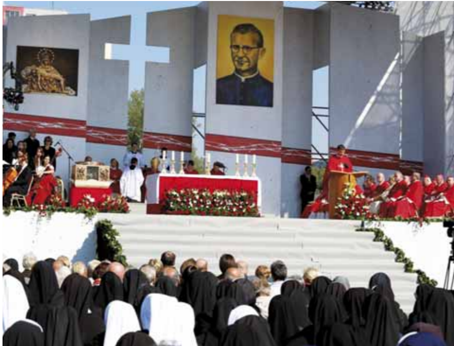
Blahorečenie Titusa Zemana v Bratislave

Keď prišiel k saleziánom do Šaštína požiadať o prijatie, tak predstavený saleziánskeho ústavu ho ako nezrelého dvanásťročného chlapca najprv odmietal. Keď sa presvedčil o jeho láske k Sedembolestnej Panne Márii a vážnom rozhodnutí žiť rehoľným životom, s dojatím ho nakoniec prijal. Titus ho nepreviedol slovami o svojom mimoriadnom, až zázračnom uzdravení, ale iba svojou skrom-