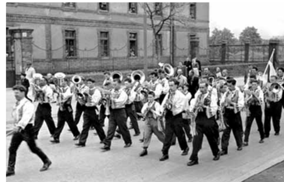
Na 1. mája pri Kutuzovových kasárňach, 1951