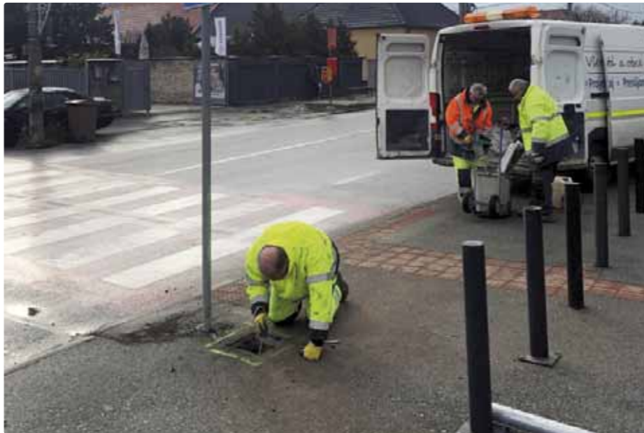
Práce na osvetlení priechodu pri zdravotnom stredisku začali

Ktoré priechody sme sa rozhodli osvetliť a prečo? Priechod na Roľníckej ulici pri Hospodárskej ulici je dlhodobým