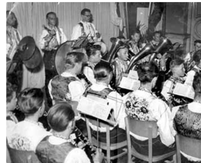
Nahrávanie pre rozhlas, 1953