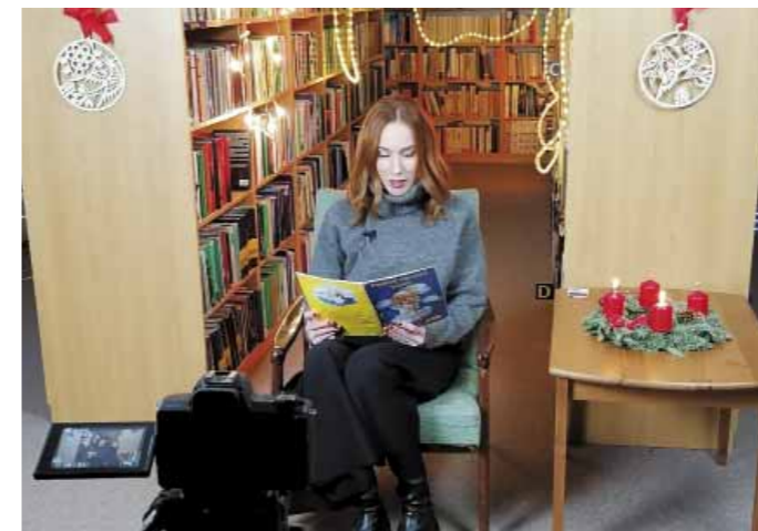
Adventné čítanie s Táňou Pauhofovou