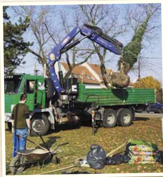
Vysadili sme živý vianočný stromček v Parku pod lipami