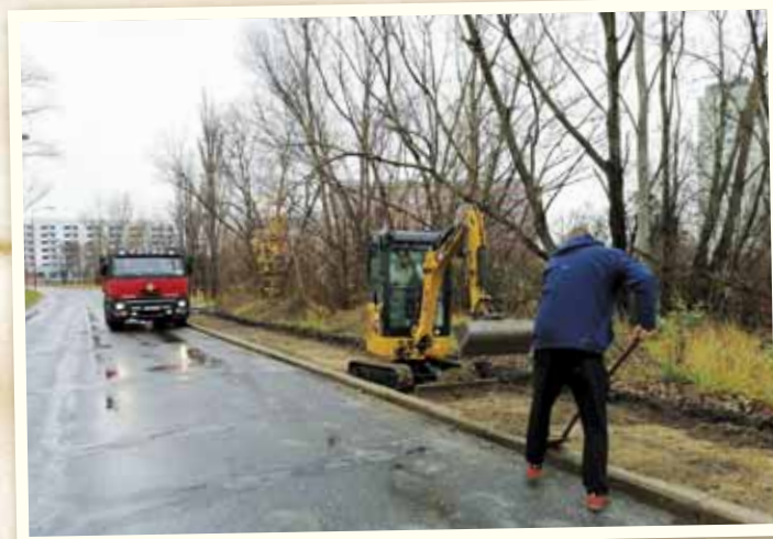
Opravili sme chodník v lokalite Rybníčná