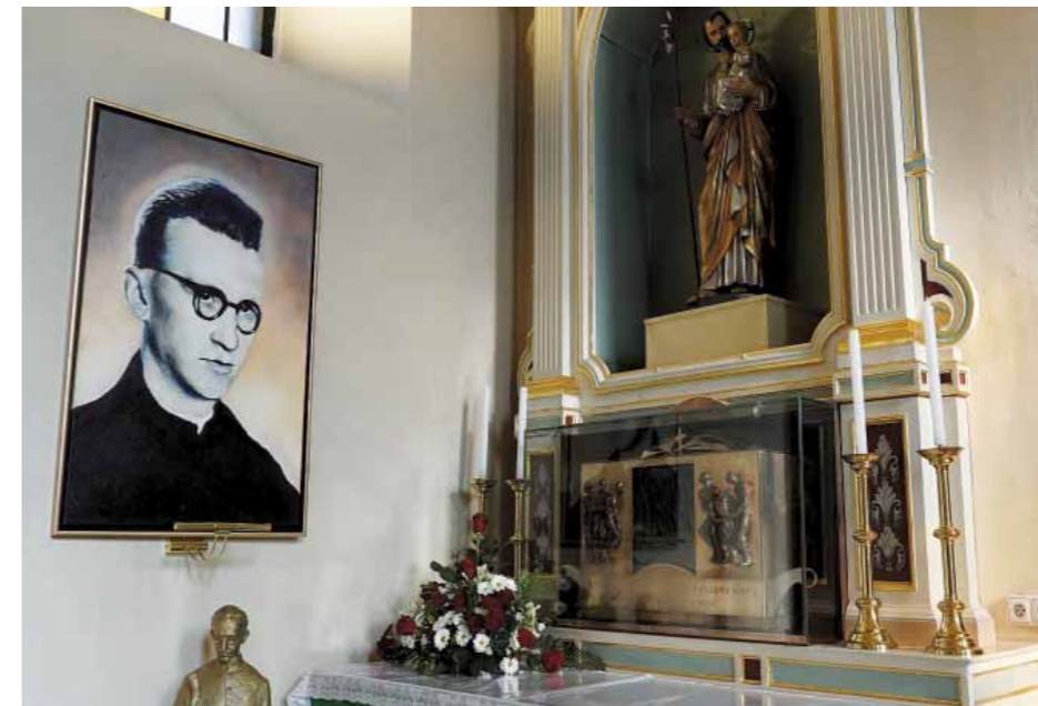
Portrét vo vajnorском chráme

A je veľmi veľký rozdiel modliť sa v tichosti sklonený, alebo byť prenasledovaný po domoch, na dvoroch, na poliach, po lesoch i za hraničnými zátarasami. Avšak najradikálnejším rozdielom je žiť zasvätený život na slobode, alebo padnúť do područia tak krutého nepriateľa viery, hoci tiež prejavy nepriateľstva na slobode sú rôzne a sú skúškou. Titus to prijal ako zápas o dušu. O ich posilu a záchranu. Vedel, že mu ide o život. Neváhal. Rovnako vedel, že tiež nemusí zvládnuť mučenie. Nesmie ani zradiť alebo zapredať seba ani iných, s ktorými bol v spojení. Za lásku sa vždy platí daň, pokiaľ ju nemá človek stratiť alebo znehodnotiť. Ako sa však platí pri najväčšej obeti svojej lásky? Príklad je na kríži... Titusov život už nepatrí jemu, ale Kristovi. Dal zo seba všetko, čo mal. A prijal aj dar mučeníctva. Prijatie daru mučeníctva bolo čisté, nechcel ho pre seba ako hrdinstvo. Pre seba samého by nešiel bojovať s tajnou políciou a so štátnym režimom. Nebol vo svojich modlitbách mimo tej ťažkej reality, chcel vydržať na začatej ceste a rástol v odvahe. Pri ohliadnutí sa nazad nepretržitý spôsob jeho obetovania sa pri záchrane duší a duchovných povolaní nemal na Slovensku obdobu a súčasne sa zaradil medzi významné ozdoby svojej rehole, ktorá patrí medzi najväčšie misijné spoločnosti na svete.