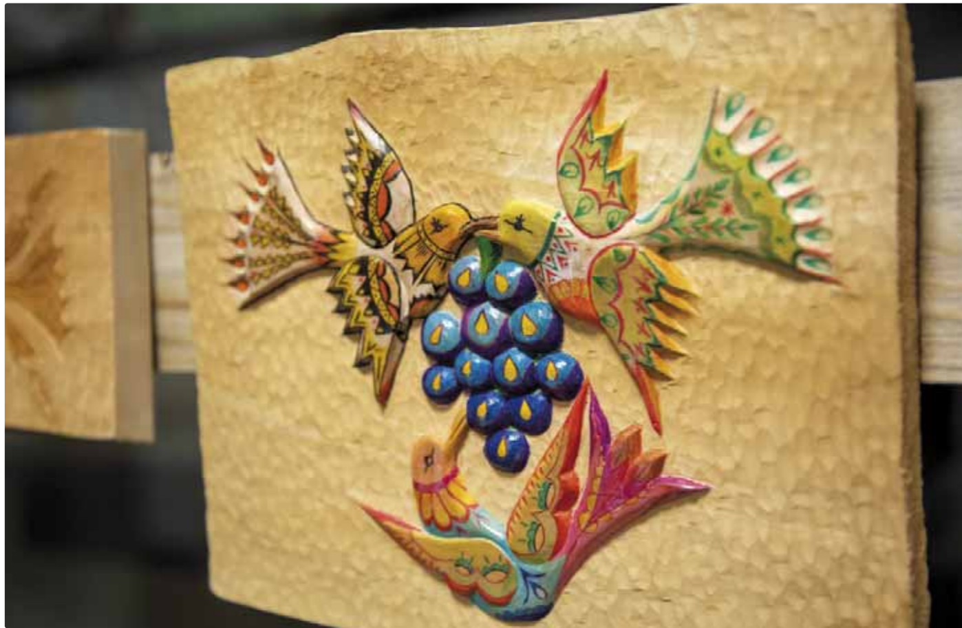
Drevorezba Štefana Zemana.