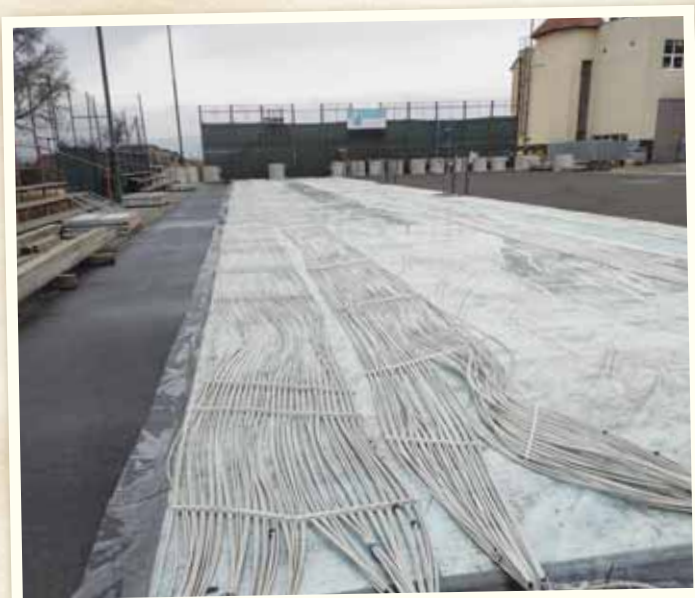
Príprava ľadovej plochy na Alviane