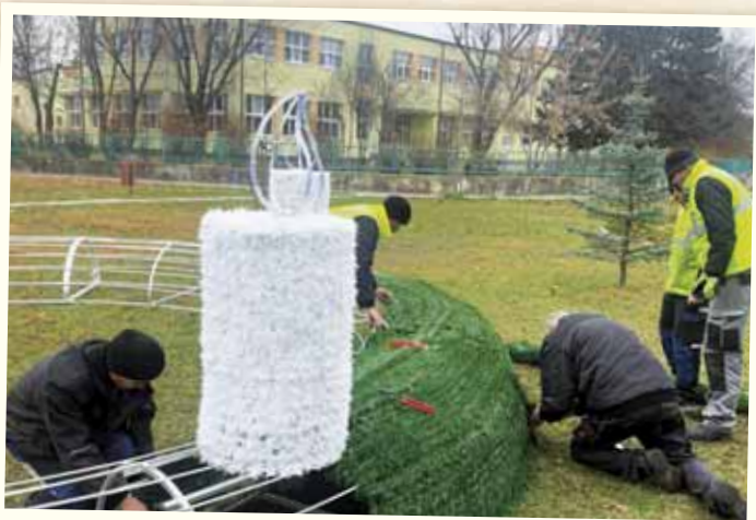
Pri škole pribudol adventný veniec