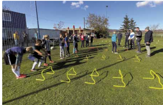
Deti a tréneri