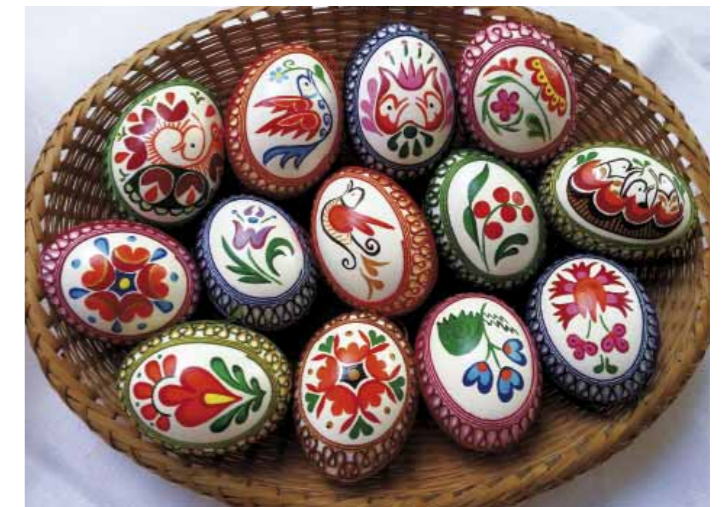
Kraslice Viery Slezákovvej. Snímka: Viera Slezáková

dernými technológiami, ale pôvodne nakreslený šikovnou pisárkou.