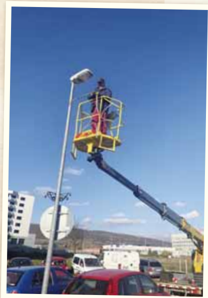
Osadenie vianočného osvetlenia na Rybníchej