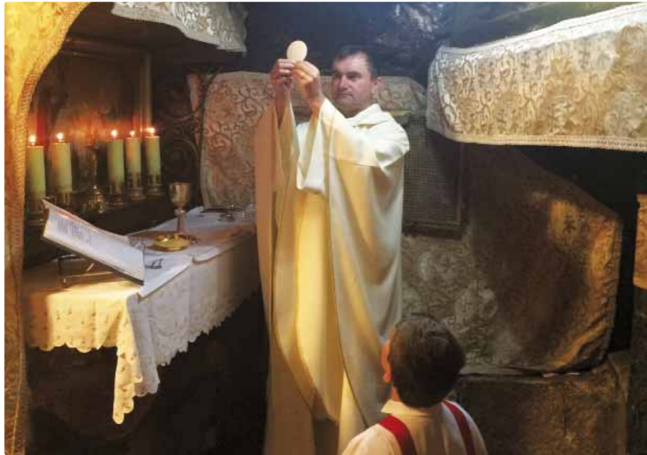
Slávenie Sv. omše