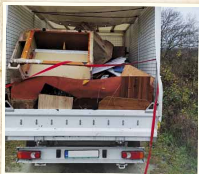
Odstránenie čiernej skládky vo vinohradoch