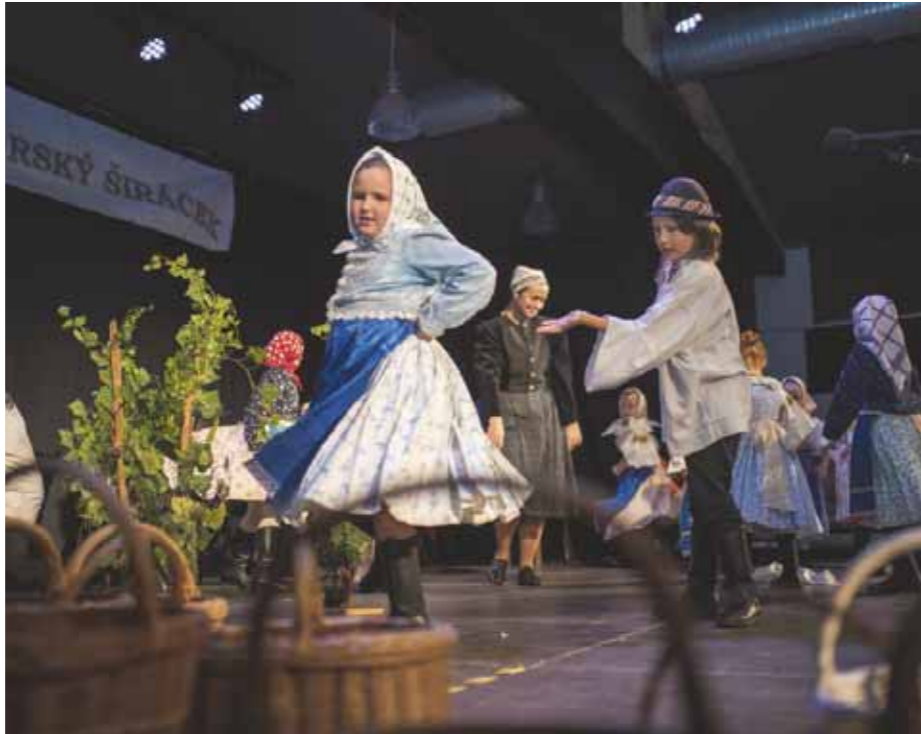
DFSk Podobenka z Vajnor