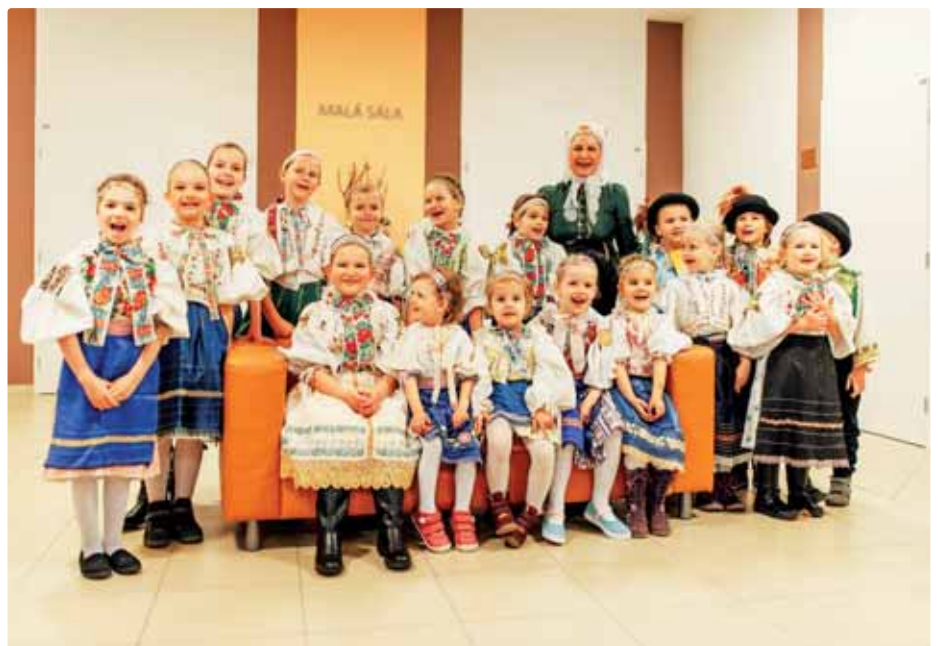
Moje deti – Podobenka z Vajnor