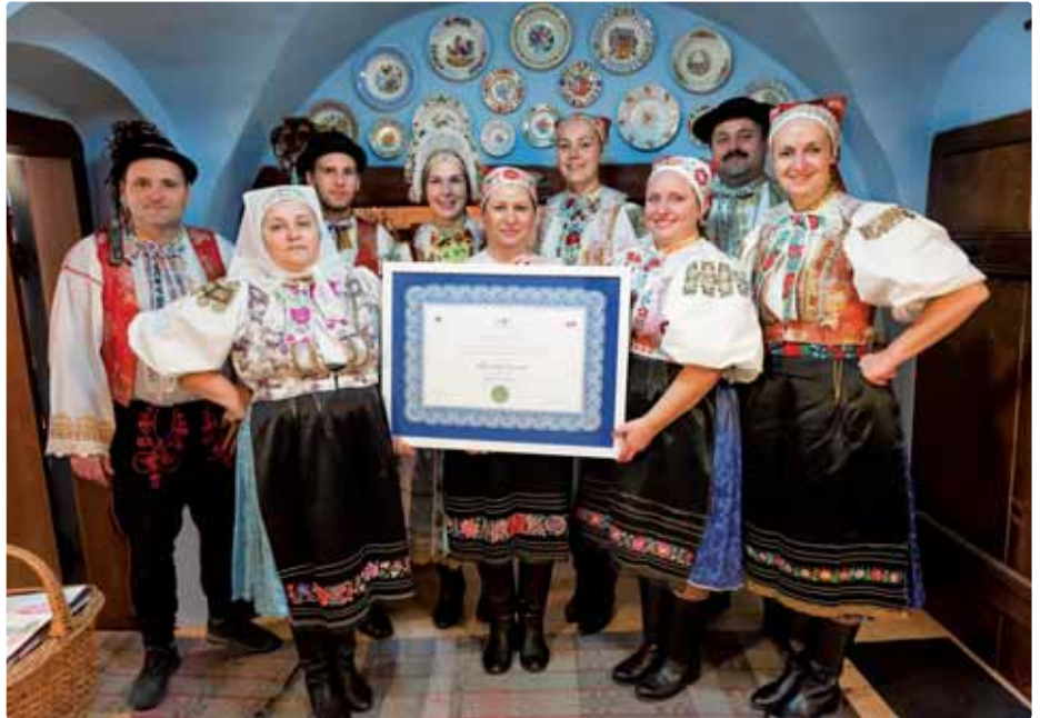
Podobenka z Vajnor – osvedčenie o zápise Vajnorského ornamentu do RZNKDS