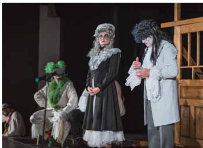
Záhorácke divadlo – Svatuškár