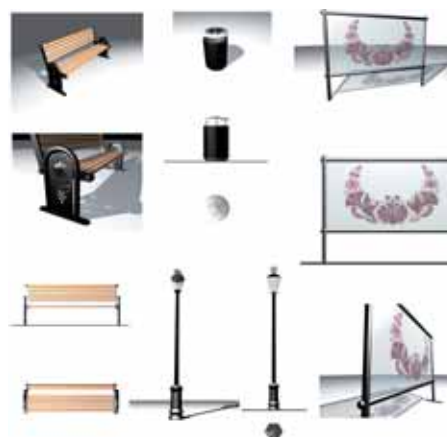
Ukážka z urbanisticko-architektonickej štúdie z r. 2004