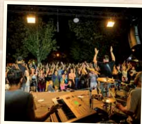
Veľkolepo sme otvorili kultúrne leto