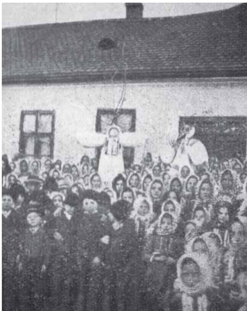
Slávnosť Kyselice na Kvetnú nedeľu

(Tlieskanie u národnostných. Veľký krik zo všetkých strán.)