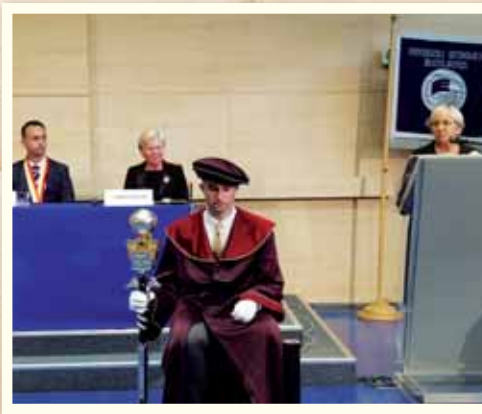
Pokračujeme v Univerzite tretieho veku