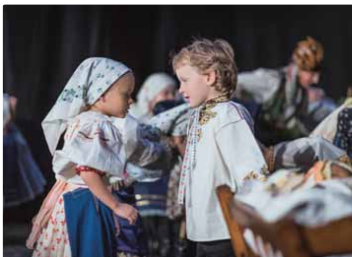
DFSk Podobenka z Vajnor

https://www.facebook.com/podobenzavajnor