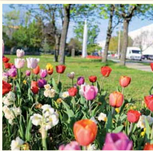
Na jar krásne rozkvitli tulipány