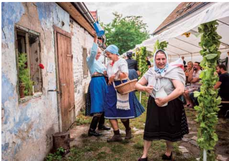
Babi z vinohradu – dvor VLD