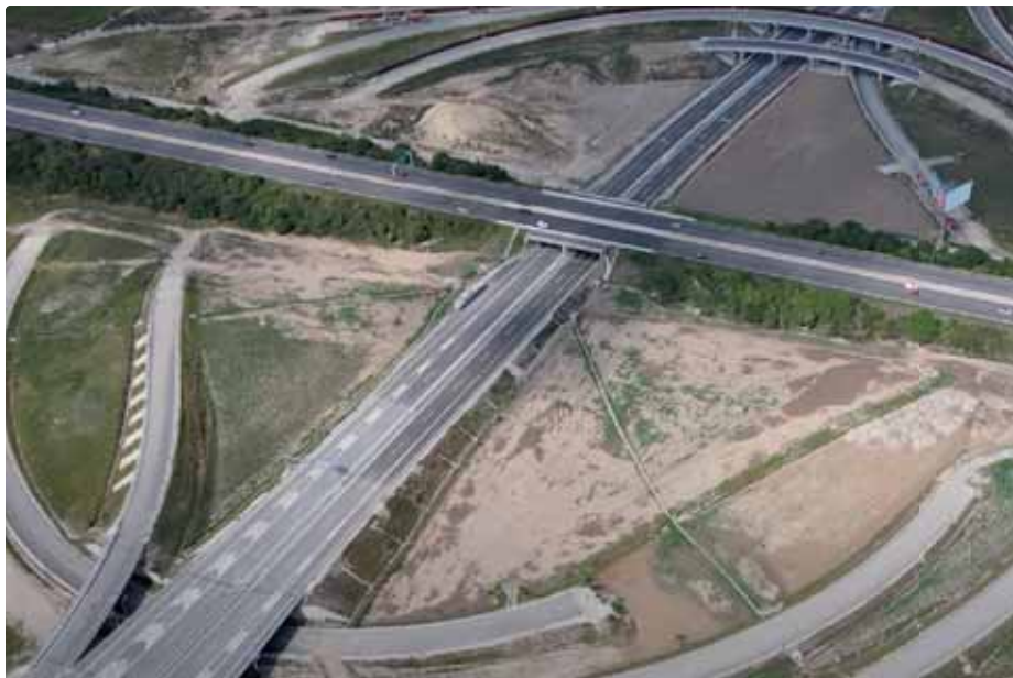
Križovatka D1D4 - existujúci stav (prevzaté)

Navyše Vajnory čaká ešte ďalšie nemalé preťaženie dopravy, ktoré bude spôso-