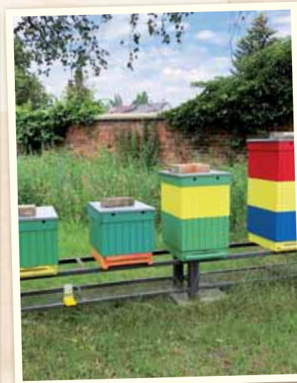
Darilo sa aj vajnorskej včelnici