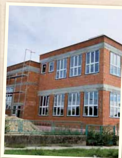
Vyrástla prístavba Základnej školy Kataríny Bruderovej