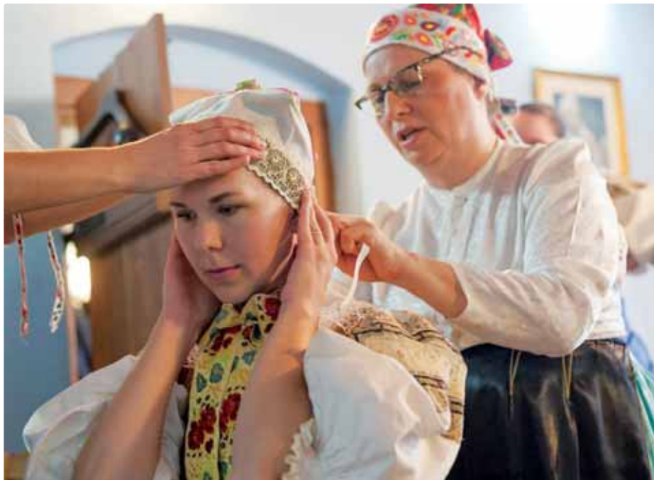
Uviazať vajnorský čepec vôbec nie je jednoduché...

Čelenky používané v súčasnosti k čepcom sú obdĺžnikové pruhy bielej látky, približne 6 cm široké a 40 cm dlhé. Novšie bývajú obrúbené úzkou čipkou alebo hadovkou, staršie sú aj bez ozdobného zakončenia. Zaväzovali sa bielymi keprovkami alebo užšími továrensky vyšívanými stužkami. Spravidla