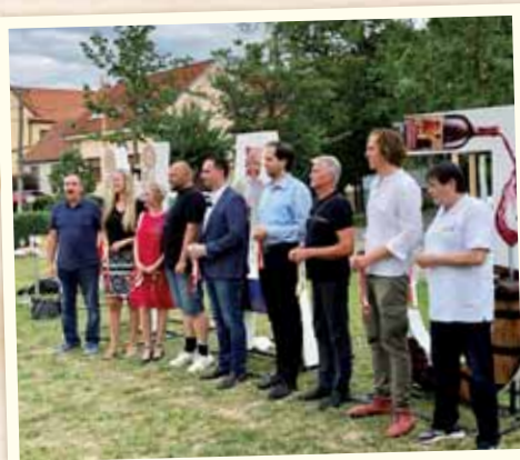
Inštalovali sme nápis Vajnory