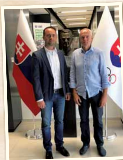
Vajnorský ornament sme ponúkli na olympiáde