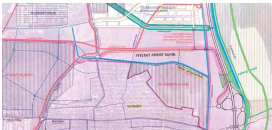
Severný obchvat Vajnora – návrh (prevzaté)

túciami (župa, NDS, MDaV SR) plánuje presadiť do investičného plánu mesta aj projekt a realizáciu Severného obchvatu Vajnora, aby mohla komunikácia prechádzajúca cez námestie prejsť od štátu pod správu MČ Vajnora. Potom by už nič nebránilo tomu, aby sa vzácne zachované námestie šošovkovitého tvaru mohlo postupne komplexne rekonštruovať. Vylúčenie tranzitnej dopravy z námestia by, okrem iného, umožňovalo aj podstatné rozšírenie a skultivovanie existujúcej zelene na námestí. Prvé návrhy rekonštrukcie námestia Vajnora boli spracované v urbanistických štúdiách už v r. 2004, ďalšie návrhy by mohli vziť zo spolupráce samosprávy s Metropolitným inštitútom Bratislavy.