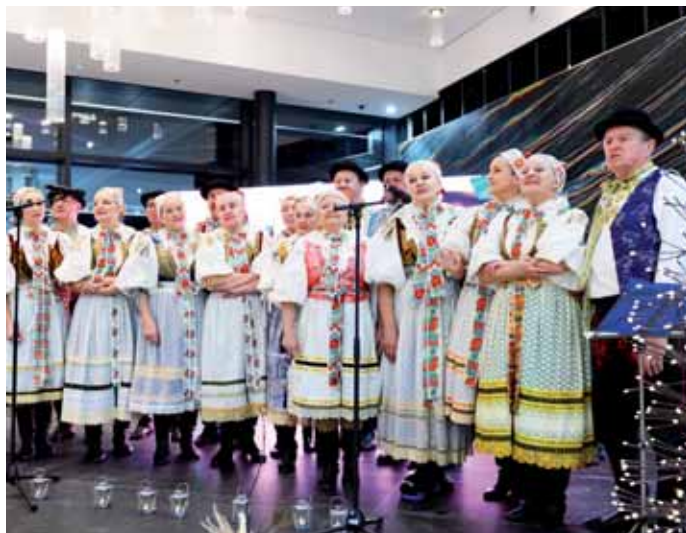
Členovia VOS na akcii Tradičné slovenské Vianoce v OC Nivy

Radi by sme sa poďakovali redakcii Slovenka za pozvanie na túto krásnu akciu plnú vianočnej atmosféry.