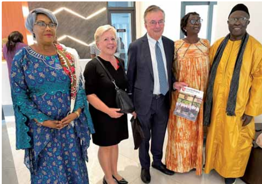
Vajnorské novinky v Senegale