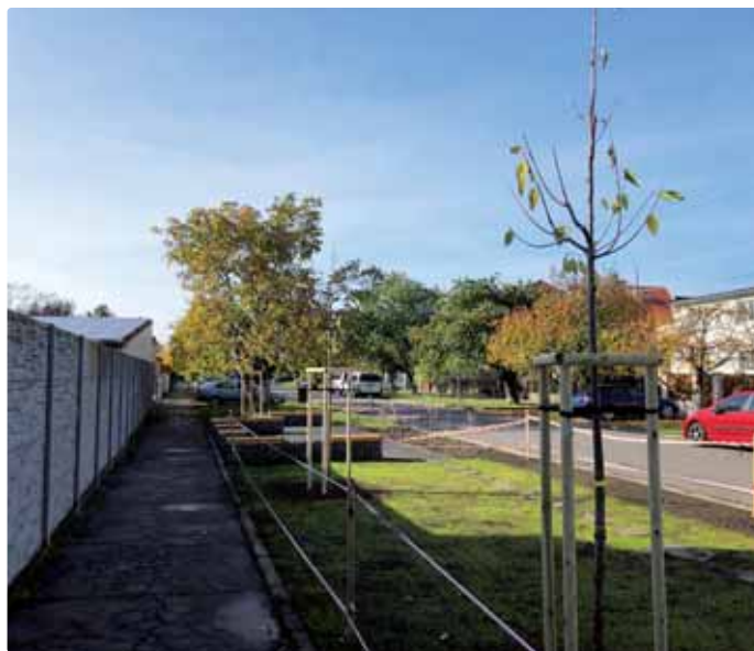
Stromčeky na Buzalkovej ulici