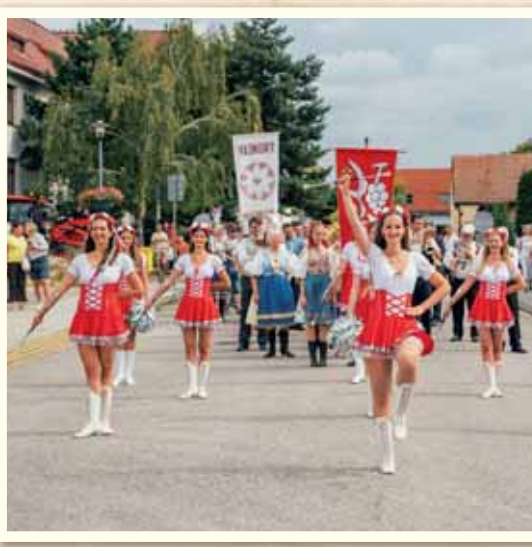
Po dvoch rokoch sa uskutočnili Vajnorské dožinky