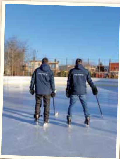
V zimných mesiacoch sme mali ľadovú plochu