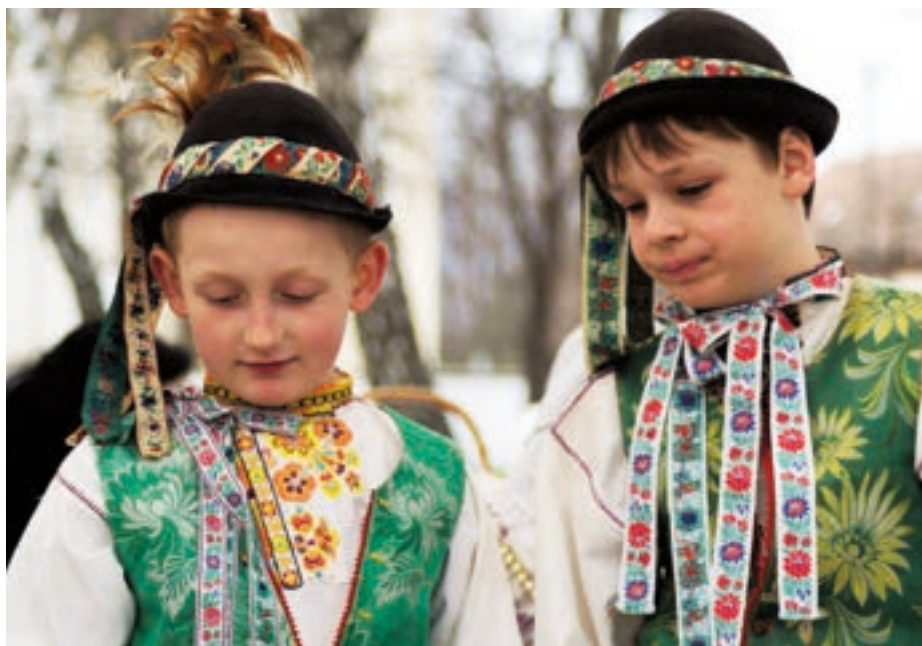
Chlapci v kroji

zošité ozdobným spojovacím švíkom. Výšivka na košielke bola – s ohľadom na menšiu veľkosť plochy, ktorá sa vyšívala – jednoduchšia ako u dospelých, rovnako ako bola drobnejšia i paličkovaná čipka. Používali sa „veselšie“ farby – žltá, oranžová, doplnková modrá, ružová či tmavšia červená. Koncept výšivky je však rovnaký ako na mužskej košeli. Podobne to bolo aj pri dievčenských rukávcoch – výšivka bola užšia a jednoduchšia ako na ženských rukávcoch, vyšitá prevládajúcou žltou a oranžovou farbou. Na výšivke detských rukávcoch a košeliach nájdeme aj monogram a rok „výroby“ – monogram však nepatrí vyšívачke, ale dieťaťu, pre ktoré sa odev zhotovoval. Najmenšie detské rukávce majú často vyšitý aj obojek, ktorý je spolu s čipkou okolo krku našitý priamo na rukávcoch a zaväzujú sa vyšívanou továrenskou stuhou. U detských rukávcov a košielok sa nestretávame často s výšivkou zlatými a striebornými niťami – dôvodom určite nie je iba ich vyššia cena, ale aj to, že detské odevy (tak ako aj dnes) potrebovali jednoduchšiu a častejšiu údržbu ako tie „dospelácke“.