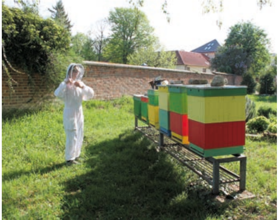
Pri ošetrovaní včelích rodín treba sa obliecť do kombinézy so siečkou na hlavu