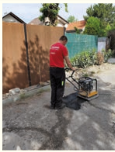
Opravovali sme komunikácie na Vajnorských jazerách