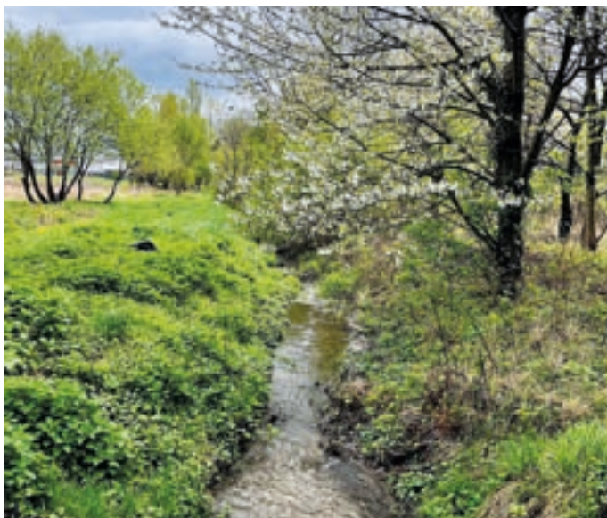
Vajnorský potok po odstránení nelegálnej hrádzky opäť tečie

Mestskej časti Bratislava-Vajnory záleží na tom, aby sa problematika Vajnorských rybníkov riešila, pretože ide o ojedinelé miesto, ktoré má veľký potenciál na ďalšie rekreačno-ekologické využitie. Problémom však je, že Vajnory nevlastnia pozemky – tie patria magistrátu a ďalším súkromným vlastníkom. Budeme však práve v spolupráci s magistrátom, dobrovoľníkmi a ďalšími, ktorí majú záujem, hľadať cesty ako prispieť k rozvoju tejto zaujímavej oblasti.