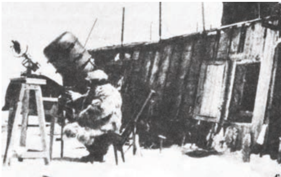
Štefánik pred observatóriom na Mont Blancu

V rokoch prvej svetovej vojny navštívil v duchu realizácie svojho poslania československé légie na ruskej Sibíri, odtiaľ cestoval