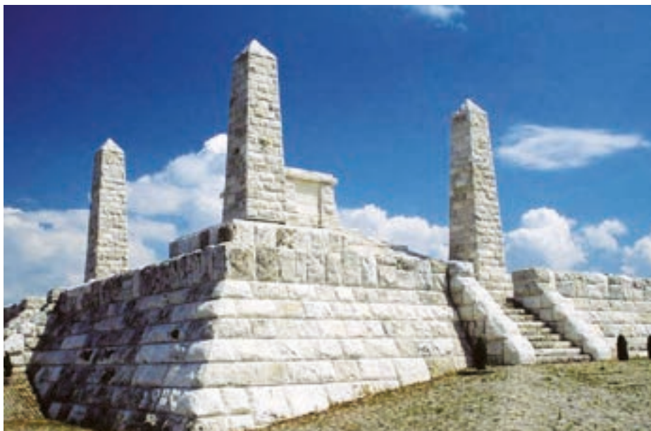
Mohyla M. R. Štefánika na Bradle

Prvý kontakt po príchode do Paríža bol síce sľubný, ale neprinášal rýchle úspechy. Napriek tomu, že neovládal francúzštinu dokonale, usilovnosťou a pracovitnosťou zaujal významného astronóma Julesa Janssena, u ktorého začal pracovať v jeho observatóriu v Meudone, ale až poldruha roka po príchode do Paríža. Významného astrofyzika čoskoro zaujal svojou pracovitnosťou, ale