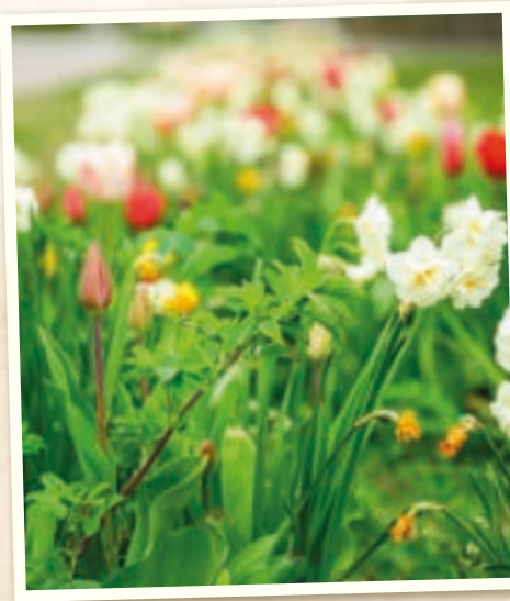
Starali sme sa o rozkvitnuté Vajnory