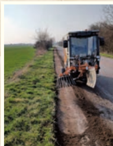
Čistili sme okolie Jurskej cesty