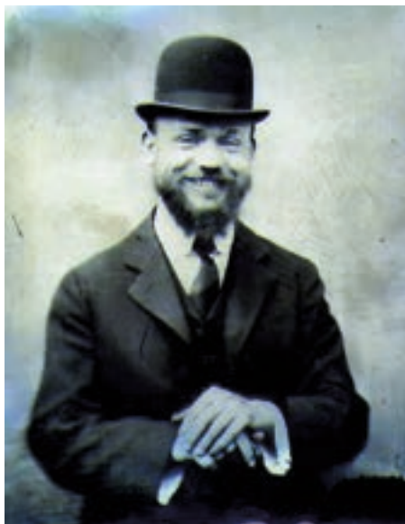
Milan Rastislav Štefánik v mladosti

Keď sa začala prvá svetová vojna, prihlásil sa Štefánik do francúzskej armády. V tom čase už mal tamjšie občianstvo. Najviac ho zaujalo letectvo. Stal sa pilotom, lietal odvážne najmä na prieskumné lety a keďže lietanie bolo a dosiaľ je závislé na počasí, nedlho nato navrhol veleniu armády vybudovať vôbec prvú meteorologickú službu, čím sa efektívnosť letectva výrazne zvýšila. Štefánik pomerne rýchlo postupoval vo vojenských hodnostiach. Dokázal sa s eleganciou a vysokou komunikatívnosťou pohybovať v najvyšších kruhoch, do ktorých vydláždil cestu aj osobnostiam vtedajšieho hnutia za vznik Československa – T. G. Masarykovi a E. Benešovi. Štátne i politické kruhy presviedčal o dôležitosti vzniku Československa, ale aj ďalších národných štátov, ktoré boli súčasťou monarchie. Uistoval ich, že budúci štát, aby mohol mať predpoklady vzniku, potrebuje svoju armádu, ktorá môže byť na úžitok aj krajinám ako Francúzsko a Taliansko vo vojne s Nemeckom a Rakúskom.