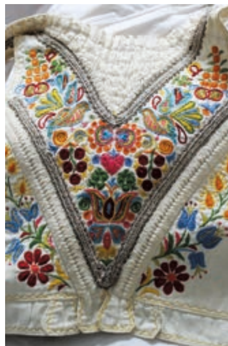
Detail dievčenského pruceľku