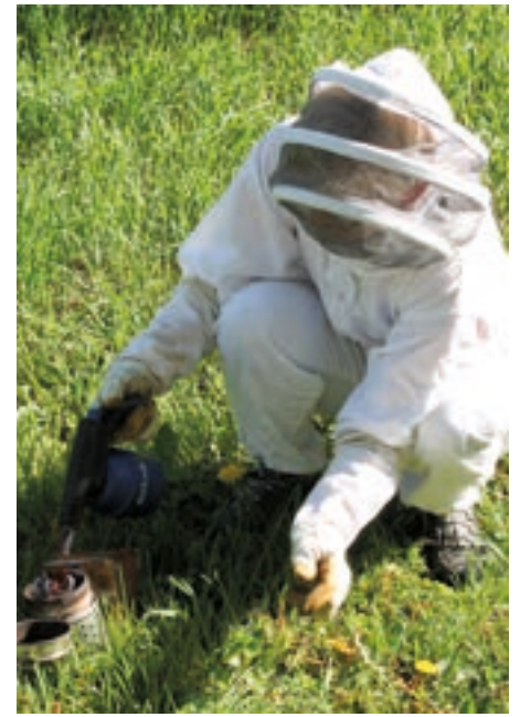
Príprava na ošetrovanie úľov

val – nepozerali sme do úľov, aby sme včielky nerušili. Sledujeme situáciu vo včelnici, či datle alebo sýkorky – nazývame ich živí škodcovia – neďobú do úľov, kontrolujeme letáče a melivo na monitorovacích podložkách. Ale v zime včielky potrebujú najmä pokoj.