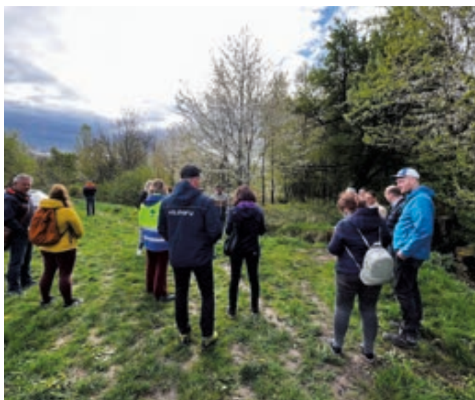
Stretnutie na Vajnorských rybníkoch

Všetci prítomní sa zhodli na nevyhnutnosti zabránenia stavania nelegálnych hrádzok a priamo na mieste jednu takúto hrádzku aj zlikvidovali, čím umožnili opätovné prúdenie vody do koryta Vajnorského potoka. Rovnako je potrebné väčšie zaangažovanie polície do kontroly v okolí Vajnorských rybníkov. Preto by sme chceli vyzvať občanov, ktorí majú vedomosť o aktivitách neznámych osôb, pravidelne spôsobujúcich záplavy v oblasti, prípadne ich videli pri čine, aby bezodkladne kontaktovali mestskú alebo štátnu políciu. Ďakujeme!