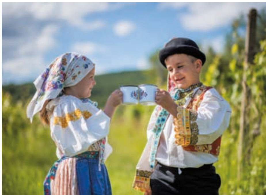
Deti v kroji