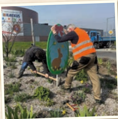
Na kruhovom objazde sme inštalovali veľkonočnú výzdobu