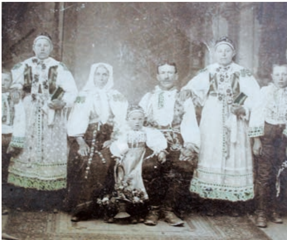
Rodina s deťmi v krojoch, 1. tretina 20. storočia. Reprodukcia fotografie z archívu Agneši Brúderovej, autorka reprodukcie: Elena Karácsonyová

Keď detičky vyrástli z kabošku, približne v troch – štyroch rokoch, chlapci dostali nohavice – galótki, dievčatá rukávečky, sukničku, záscerku a pruclek. Detský odev je od tohto momentu vlastne „zmenšeninou“ odevu dospelých. Pruclek (živôtik) býval pre deti z kašmírovej látky, brokátu či inej jednofarebnej látky s drobnejším vzorom. Prucleky boli, najmä v novšom období, často vyšívane – tak ako u dospelých. Dievčenské prucleky boli zdobené tzv. kaňírmi – ťahanou nazberanou ozdobou a – ak neboli vyšívane – aj našitými zlatými či striebornými bortňami .