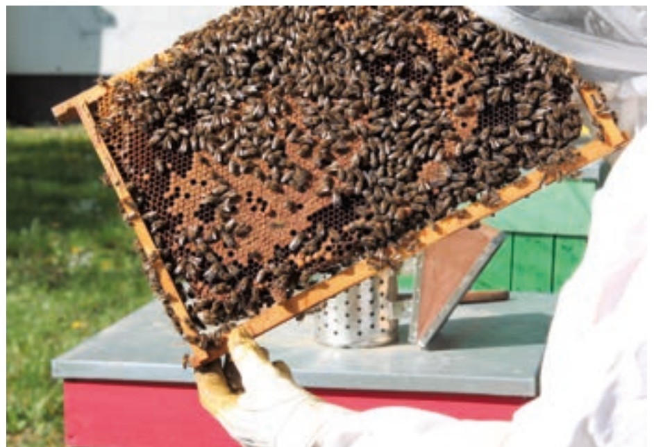
Včielky zohrievajú matku uprostred kruhu