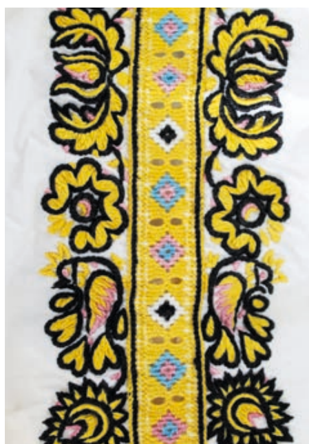
Detail výšivky na detských rukávcoch