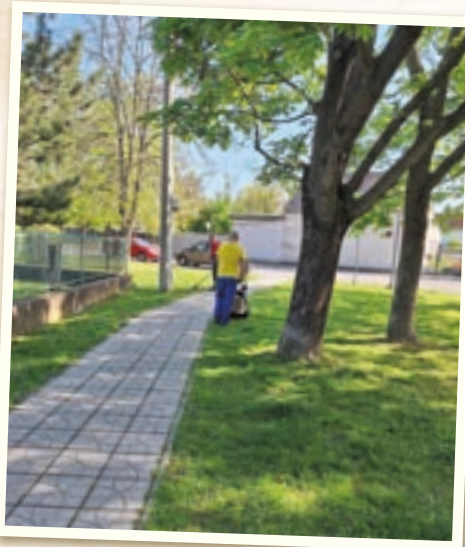
Prvé jarné kosenie trávnikov v mestskej časti