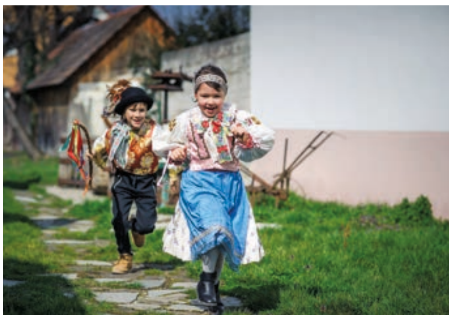
Deti v kroji

Galótki mali chlapci jednoduché, čierne, alebo ozdobené červeným šujtášom. Sukničky pre dievčatá bývali z bielych kvetovaných látok. Zásterky sa šili z lesklej látky modrej farby, ozdobené boli nášivkami alebo výšivkou – tak ako zástery ich mám.