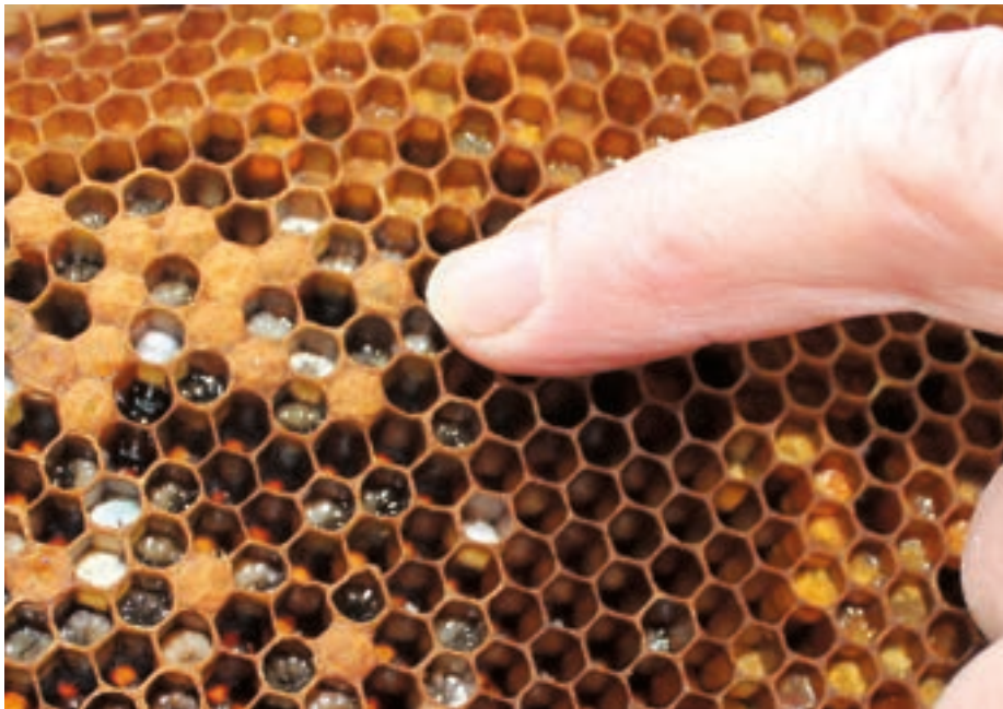
Takto je zaistená včelia larva