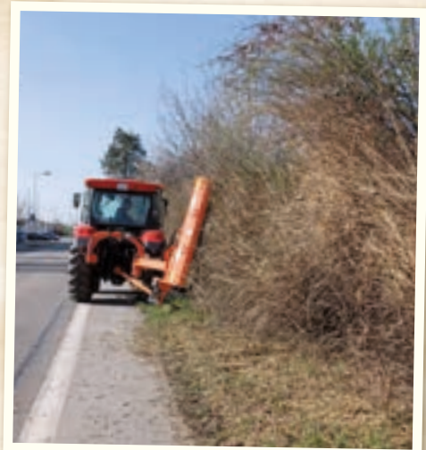
Orezávali sme kríky na cestách