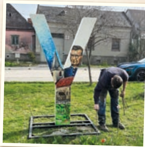
Po zime sme opäť nainštalovali nápis Vajnory