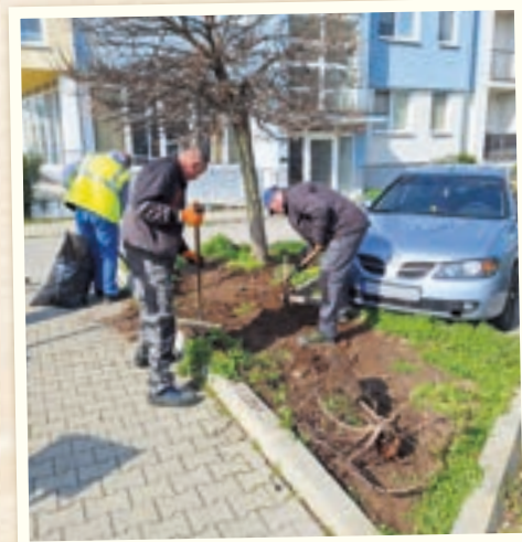
Sadili sme zeleň na rôznych lokalitych